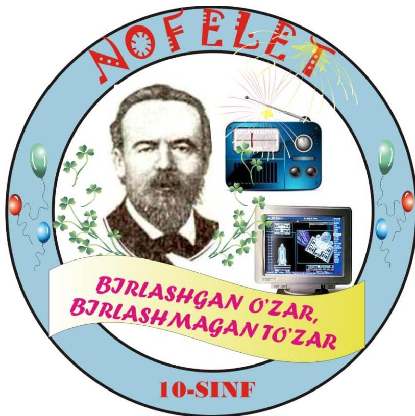
Nofelet guruhi ko'krak nishoni

Boshlovchi: Rahmat. Endi esa shu shart bo'yicha navbatni 10-sinfning "NOFELET" guruhiga beramiz. Marhamat.