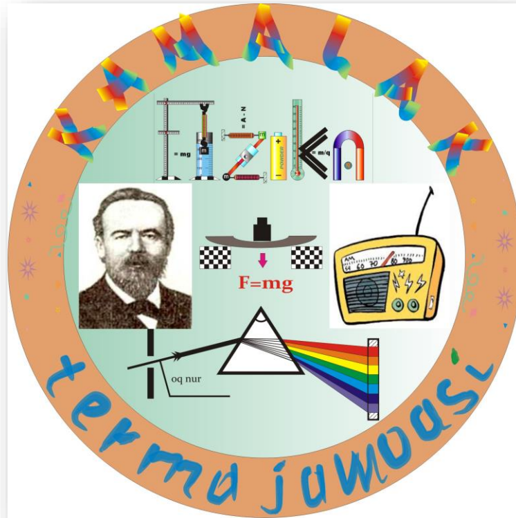
Kamalak guruhi ko'krak nishoni

Har uchala jamoalarga omad tilaymiz. Marhamat, 1-shart bo'yicha 9-sinfning "KAMALAK" guruhini taklif etamiz.